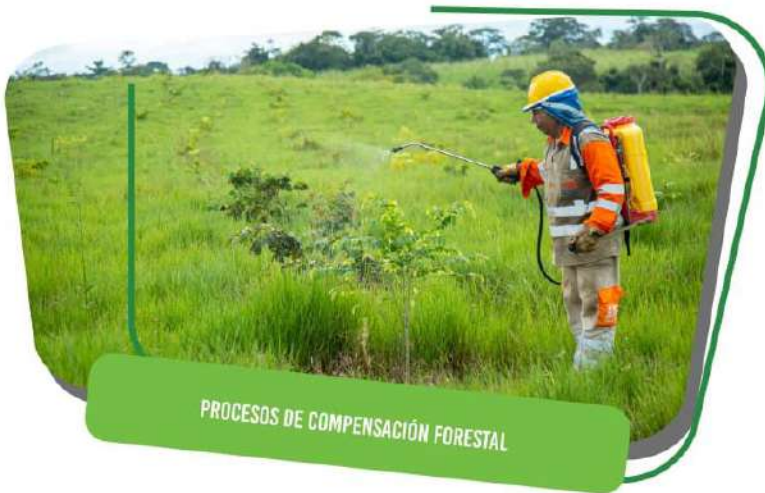
PROCESOS DE COMPENSACIÓN FORESTAL

Contamos con una Gestión Ambiental responsable y amigable con el medio ambiente, que se lleva a cabo dando cumplimiento a todos los permisos y licencias ambientales requeridos por las corporaciones y Autoridad de Licencias Ambientales.