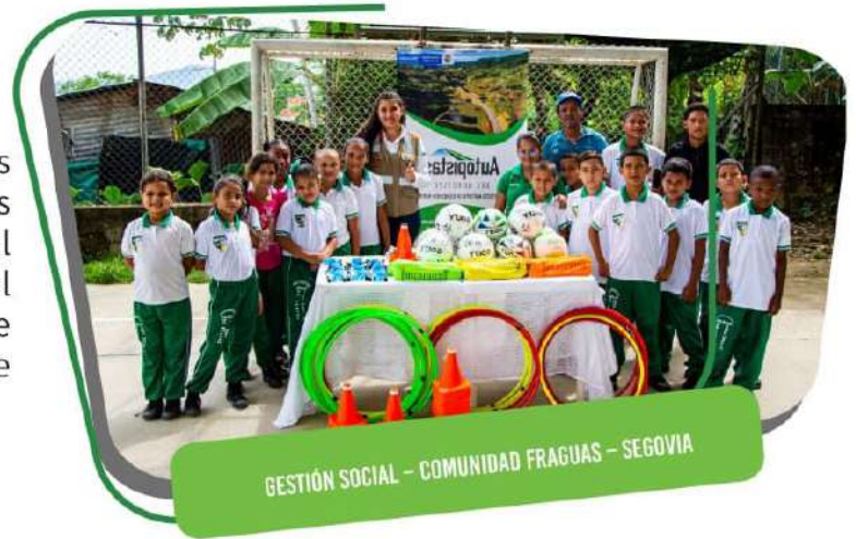
GESTIÓN SOCIAL - COMUNIDAD FRAGUAS - SEGOVIA

Desde la Gestión Social se desarrollan procesos de transformación comunitaria, a través de las capacitaciones, las iniciativas productivas, el control social de las obras de infraestructura, el relacionamiento con los diferentes públicos de interés, el mejoramiento de las condiciones de vida los pobladores y la generación de empleo.