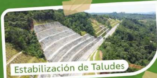
Estabilización de Taludes