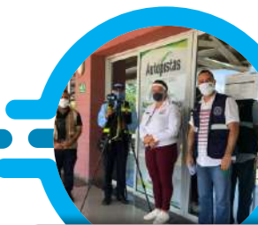
Entrega de Radar de Velocidad a la Secretaría de Tránsito Cauca.