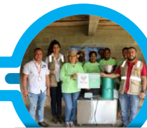
Entrega de peletizadora en Ecogranja El Progreso