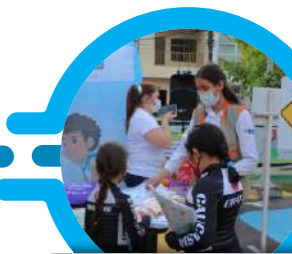
Semana Seguridad vial con Secretaría de Tránsito Cauca