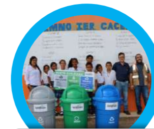
Entrega de Puntos Ecológicos Institución Educativa Cacerí