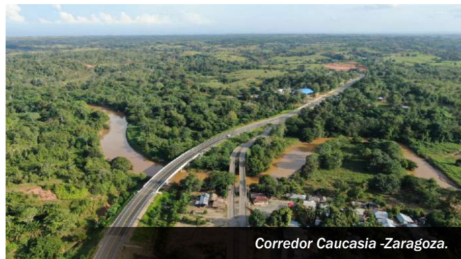
Corredor Cauca - Zaragoza.

Es una obra diseñada para brindar confort y seguridad al usuario, cuenta con 18 cámaras de seguridad monitoreadas a lo largo del corredor vial, servicios viales las 24 horas grúa, ambulancia, carro taller e inspección vial, totalmente gratuitos, además, cuenta con postes S.O.S. Instalados a lo largo del corredor vial, con el fin que el usuario pueda solicitar los servicios viales, también se instalaron paradores de buses, reductores de velocidad en centros poblados y toda la señalización vial necesaria en las zonas escolares.