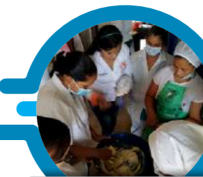
Capacitación en Manipulación de Alimentos, Cacerí, Cauca