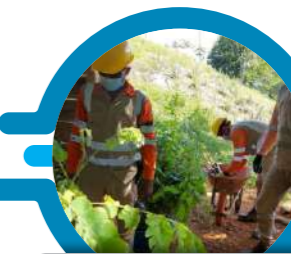
Donación de 300 árboles en Fraguas, Segovia