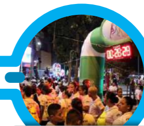
Vinculación a Carrera Atlética Nocturna, Cauca.