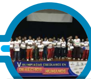
Vinculación en Olimpiada de Derechos Humanos