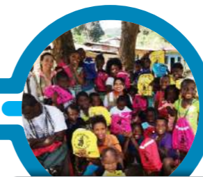
Entrega de kits Escolares vereda El Cenizo