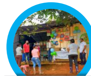
Donación computador a la Asociación de mujeres AMURPAZ, Segovia