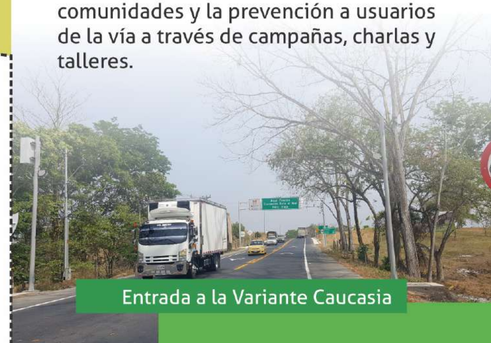
Entrada a la Variante Caucasia