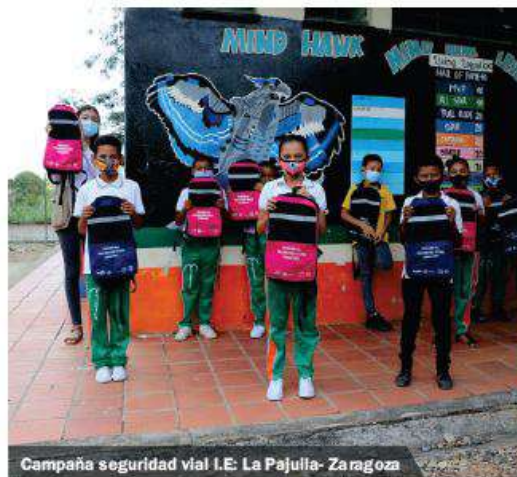
Campaña seguridad vial I.E. La Pajulla- Zaragoza