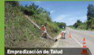
Empradización de Talud