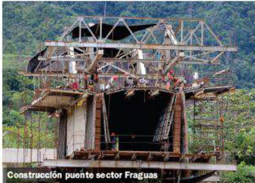
Construcción puente sector Fraguas