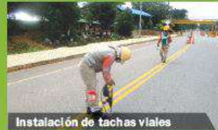
Instalación de tachas viales