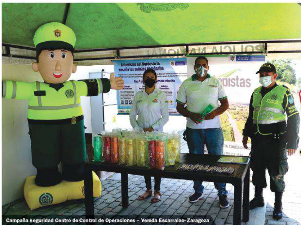
Campaña seguridad Centro de Control de Operaciones – Vereda Escarralao- Zaragoza