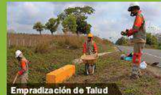
Empradización de Talud