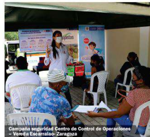
Campaña seguridad Centro de Control de Operaciones – Vereda Escarralao- Zaragoza