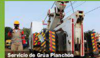
Servicio de Grúa Planchón