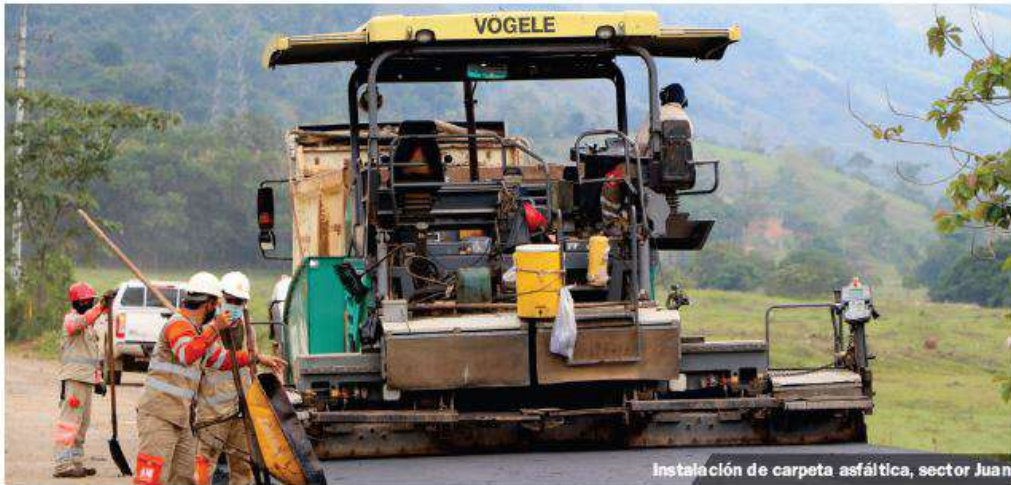
Instalación de carpeta asfáltica, sector Juan

Con todas las medidas de seguridad, cada uno de los colaboradores de este importante proyecto, trabajan día a día para lograr esta eficiente conexión, entre el interior de país y la costa caribe, pese a las adversidades, la concesión Autopistas del Nordeste avanza en la construcción de la Autopista Conexión Norte, con un importante avance general del 76.54%.