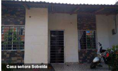
Casa señora Sobeida

“El cambio ha sido grande para mi y para mi familia” Sobeida Durango.