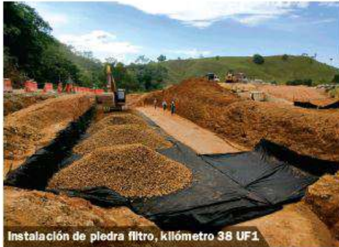
Instalación de piedra filtro, kilómetro 38 UF1