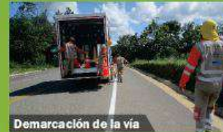
Demarcación de la vía