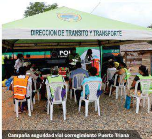
Campaña seguridad vial corregimiento Puerto Triana

Todo con el objetivo de sensibilizar a la comunidad sobre la importancia del buen comportamiento en la vía, de proteger la vida de cada uno y de ser conductores ejemplares.