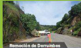
Remoción de Derrumbes