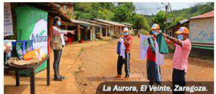
La Aurora, El Veinte, Zaragoza.

La Concesión Autopistas del Nordeste ha realizado la donación de más de 320 kits de desinfección a las comunidades aledañas al proyecto vial Autopista Conexión Norte, a través de campañas de seguridad vial, con el propósito de contribuir al cuidado para la no propagación del coronavirus Covid-19 y, concientizar a los usuarios viales sobre la movilidad segura y cumplimiento de las normas de tránsito.