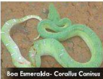
Boa Esmeralda- Corallus Caninus

Boa esmeralda también conocidas como boas de bates; aunque se distribuye en toda Colombia, en el proyecto solo ha sido registrada en el tramo Remedios - Zaragoza, es arbórea y de hábitos nocturnos. Durante el día se encuentra enrollada en ramas de 3 a 10 metros de altura. Activas durante la noche, suele cazar en ramas a 5 metros de altura.