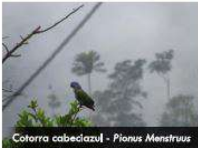
Cotorra cabeciazul - Pionus Menstruus

Cotorra cabeciazul también conocida como cotorra cheja, se encuentra ampliamente distribuida en todo el corredor vial, es un ave que se alimenta principalmente de frutos y semillas, se le puede apreciar en bandadas de hasta 10 individuos o en parejas. Comúnmente es extraída de su hábitat natural para tenerla como mascota.