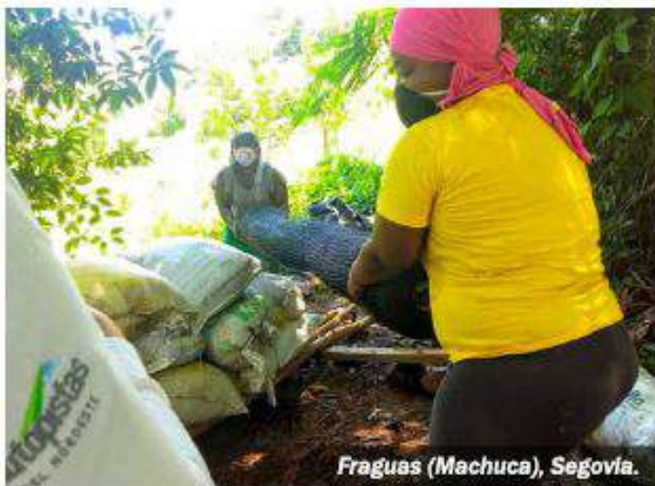
Fraguas (Machuca), Segovia.

Con el propósito de apoyar a más de dieciséis familias de las comunidades del corregimiento de Fraguas, Machuca y las veredas El Cenizo y La Caliente, la Concesión Autopistas del Nordeste fortalece las iniciativas productivas de la Asociación de Mujeres por la Reconciliación y la Paz - AMURPAZ y la Asociación de Mujeres del Cenizo y la Caliente - CENICAL a través de la donación de herramientas y abono, que permitirán mejorar las huertas caseras en las que madres cabeza de familia laboran para activar la economía de la región.