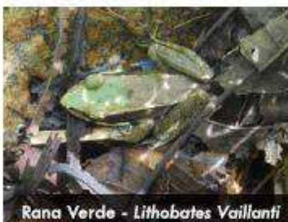
Rana Verde - Lithobates Vaillanti

Rana verde , habita en bosques húmedos tropicales y secos. Es nocturna, terrestre y puede encontrarse en áreas abiertas artificiales, donde puede ser muy común. Está asociada a cuerpos de agua, especialmente a estanques y otras formas de agua estancadas, por lo general, permanece en los bordes, se puede encontrar en área de influencia del proyecto.