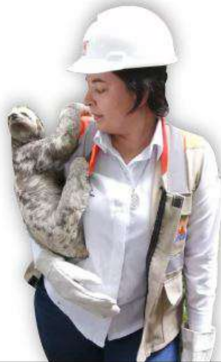
Rescate De Oso Perezoso De Tres Dedos - Bradypus Variegatus

Adicional, se realizan actividades de monitoreo de fauna silvestre para establecer comportamiento, función ecológica y determinar la densidad poblacional.