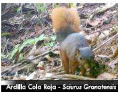
Ardilla Cola Roja - Sciurus Granatensis

Ardilla cola roja o ardilla colirroja, es una especie considerada endémica de América del sur y se encuentra en todo el proyecto. Es una especie diurna, arborícola y solitaria; se alimenta de frutos y semillas, se considera un dispersor de semillas por excelencia.