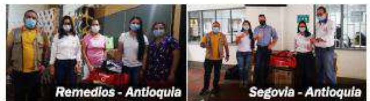
Remedios - Antioquia

La Concesión Autopistas del Nordeste ha realizado la donación de más de 320 kits de desinfección a las comunidades aledañas al proyecto vial Autopista Conexión Norte, a través de campañas de seguridad vial, con el propósito de contribuir al cuidado para la no propagación del coronavirus Covid-19 y, concientizar a los usuarios viales sobre la movilidad segura y cumplimiento de las normas de tránsito.