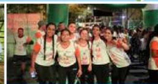
ASÍ SE VIVIÓ LA CARRERA ATLÉTICA NOCTURNA POR LA PAZ PAG 4