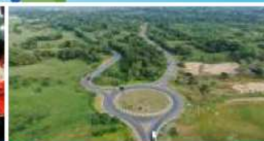
AUTOPISTAS DEL NORDESTE GENERANDO CAMBIOS IMPORTANTES PAG 6