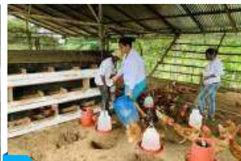
Galpones gallinas ponedoras