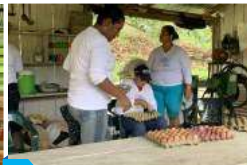
Proceso de empaque huevos