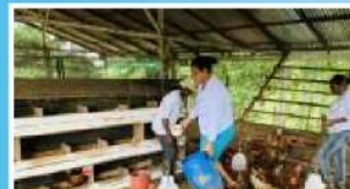
CONOCE LA ECOGRANJA EL PROGRESO PAG 2

MENOS VELOCIDAD MÁS VIDAS EN LA CARRETERA