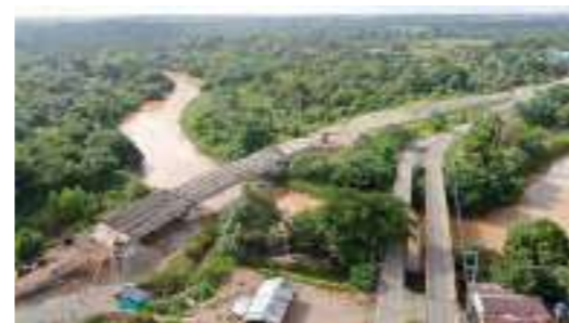
Corredor Vial Caucasia- Zaragoza Construcción Puente Cacerí