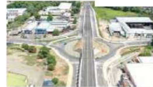
Glorieta Variante - Caucasia