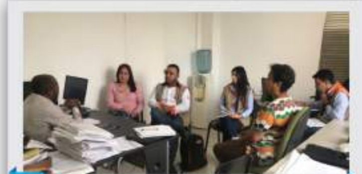
Alcaldía de Zaragoza