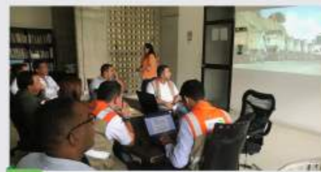
Alcaldía de El Bagre