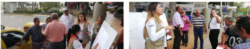
Sensibilización Terminal de Transporte y gremio taxistas de Caucasia