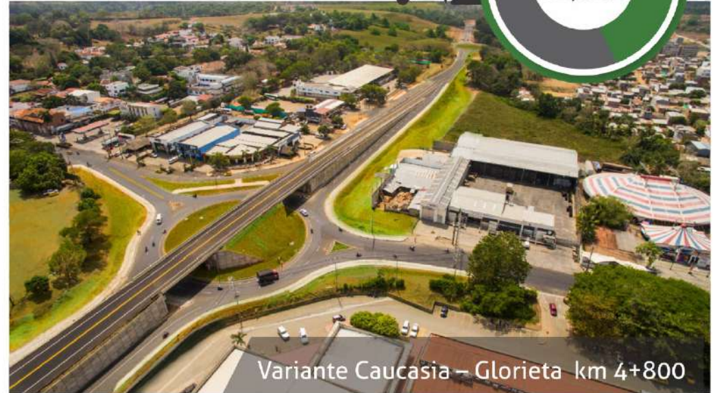
Variante Caucasia – Glorieta km 4+800

En un 92,64% avanza la ampliación y mejoramiento de la vía Caucasia – Zaragoza, esta obra que mejorará la movilidad entre el Bajo Cauca y Nordeste antioqueño, sería entregada en el primer semestre del año 2019, completamente terminada, señalizada y con la instalación del peaje Zaragoza, que se ubicará en el kilómetro 21 + 300, entre las comunidades de Escarralao y el Cincuenta.