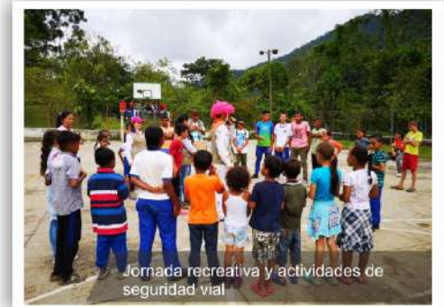
Jornada recreativa y actividades de seguridad vial