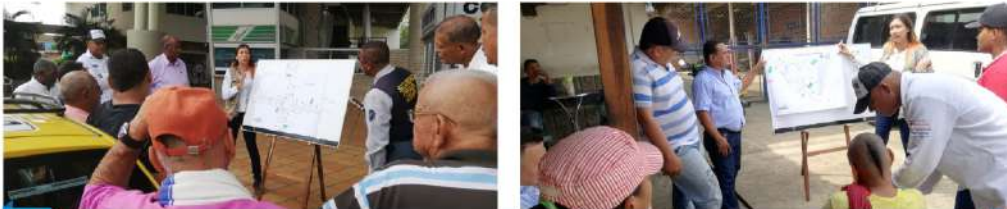
Sensibilización cómo circular por las Glorietas de la variante Caucasia

La concesión Autopistas del Nordeste, continúa sensibilizando a los usuarios viales, a través de campañas y pedagogía sobre cómo circular en las glorietas de la Variante Caucasia, a motociclistas, conductores de vehículo y empresas transportadoras. Le recomendación para todos es a respetar los límites de velocidad al transitar por las glorietas y tener e cuenta la señalización vial.