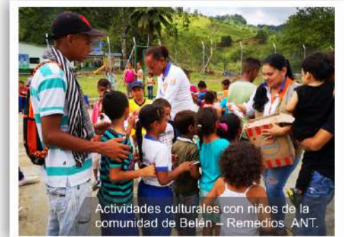
Actividades culturales con niños de la comunidad de Belén – Remedios ANT.