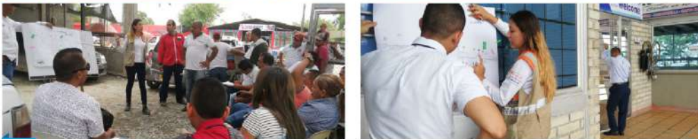
Usuarios, transportadores de pasajeros vía Caucasia - Zaragoza