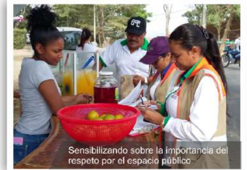
Sensibilizando sobre la importancia del respeto por el espacio público