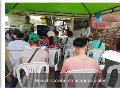
Sensibilización de usuarios viales