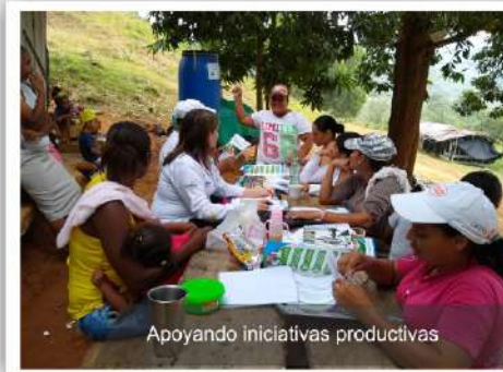
Apoyando iniciativas productivas