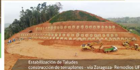
Estabilización de Taludes construcción de terraplenes - vía Zaragoza- Remedios UF1

Desde 2015 se viene desarrollando el proyecto de cuarta generación Autopistas Conexión Norte, una iniciativa a cargo de la Concesión Autopistas del Nordeste, el cual tiene una longitud total de 145 kilómetros y contempla tres obras principales : una nueva vía en calzada sencilla entre los municipio de Remedios y Zaragoza con 58 KM (Unidad Funcional 1), el mejoramiento de la