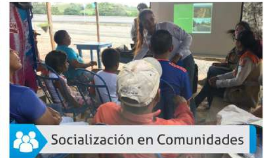
Socialización en Comunidades