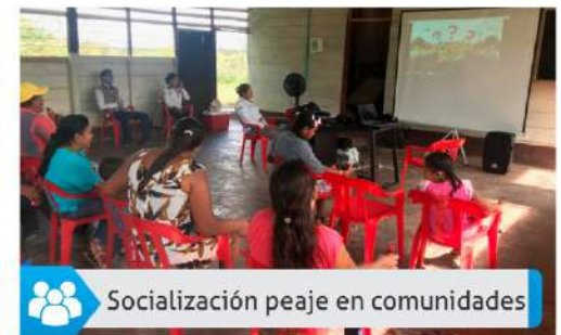
Socialización peaje en comunidades