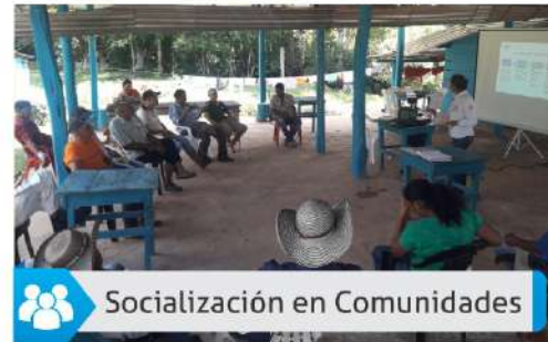
Socialización en Comunidades

Seguimos en proceso de informar a las comunidades todos los detalles de la instalación del peaje Zaragoza, en el sector de Escarralao.