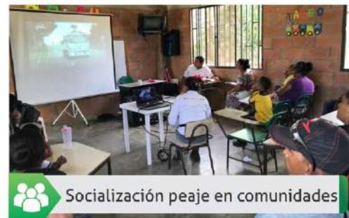
Socialización peaje en comunidades