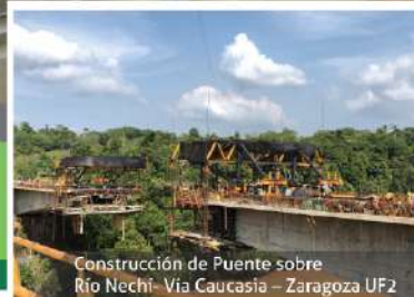
Construcción de Puente sobre Río Nechí- Vía Caucaasia – Zaragoza UF2

y prosperidad para los municipios del Bajo Cauca antioqueño.