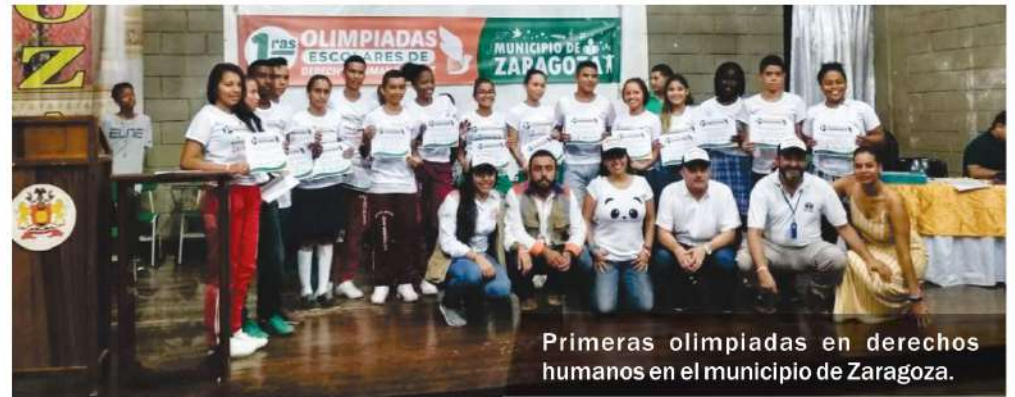
Primeras olimpiadas en derechos humanos en el municipio de Zaragoza.