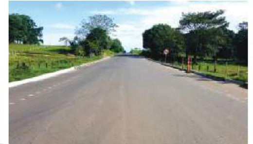
Estado actual del tramo vial Caucasia – Zaragoza- obras de ampliación y mejoramiento