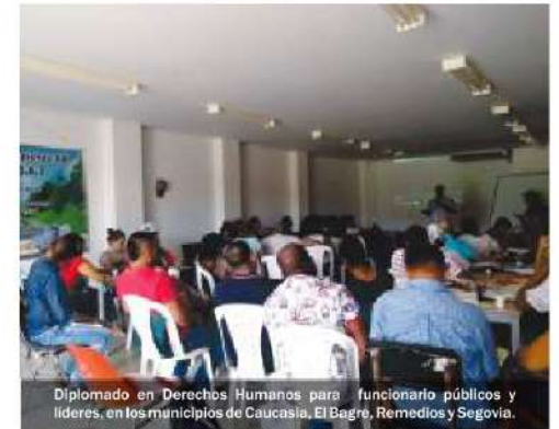
Diplomado en Derechos Humanos para funcionarios públicos y líderes, en los municipios de Caucasia, El Bagre, Remedios y Segovia.