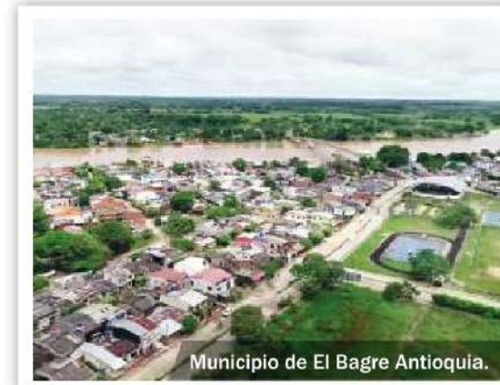
Municipio de El Bagre Antioquia.

Otro de los destinos que estará más cerca de todos con la Autopista Conexión Norte es El Bagre, municipio antioqueño, ubicado en la subregión de Bajo Cauca y caracterizado por su riqueza en oro, la pesca, agricultura y su gente cálida, amable y trabajadora.