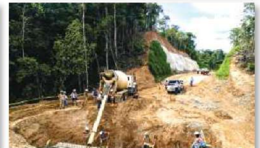
Construcción vía Zaragoza - Remedios