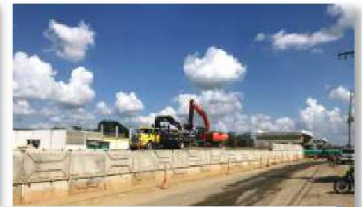
Construcción de la variante Caucasia a cargo del grupo constructor Ortiz