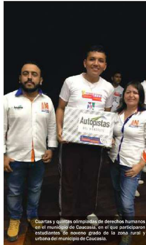
Cuartas y quintas olimpiadas de derechos humanos en el municipio de Caucasia, en el que participaron estudiantes de noveno grado de la zona rural y urbana del municipio de Caucasia.