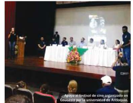
Apoyo al festival de cine organizado en Caucasia por la universidad de Antioquia.