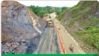
MEJORAMIENTO DE VÍA CAUCASIA- ZARAGOZA