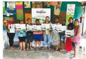
Entrega de certificaciones en vereda Limón Afuera de Zaragoza

La Concesión Autopistas del Nordeste, en convenio con el SENA capacitó cerca de 250 personas de las comunidades del área de influencia del proyecto, los cursos ofrecidos fueron Higiene y Manipulación de Alimentos y Productos de Panificación. Las comunidades beneficiadas fueron; el corregimiento Puerto Triana y el Barrio Buenos Aires 1 del municipio de Cauca, las veredas la Maturana, El Cincuenta, El Veinte, Limón Afuera, La Porquera del municipio de Zaragoza. A través de estos, se busca cualificar a las familias pertenecientes a las comunidades en las que hace presencia el proyecto y garantizar de este modo el adecuado desarrollo de sus actividades en restaurantes comerciales y escolares, además de incentivar la conformación de nuevas iniciativas productivas.