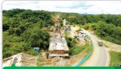
CONSTRUCCIÓN DEL PUENTE SOBRE RÍO NECHÍ