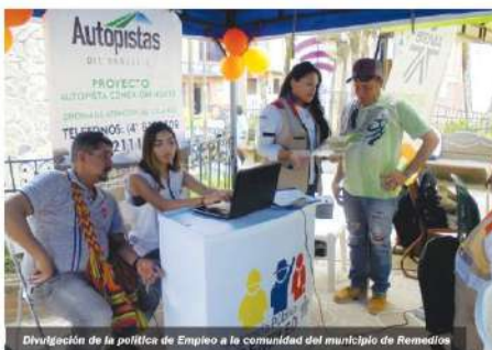
Divulgación de la política de Empleo a la comunidad del municipio de Remedios