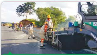
INSTALACIÓN DE MEZCLA ASFÁLTICA