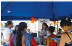
FERIA DE EMPLEO EN REMEDIOS PAG 8