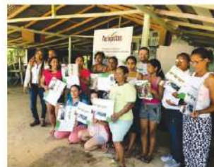
Entrega de certificaciones en vereda La Porquera de Zaragoza