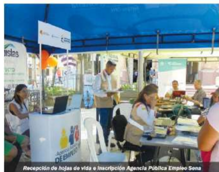
Recepción de hojas de vida e inscripción Agencia Pública Empleo Sena