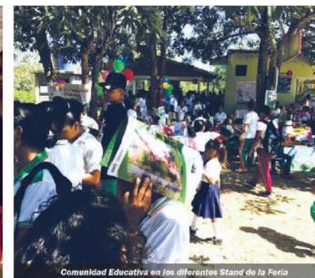
Comunidad Educativa en los diferentes Stand de la Feria