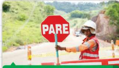
MUJERES DEL ÁREA DE INFLUENCIA DIRECTA