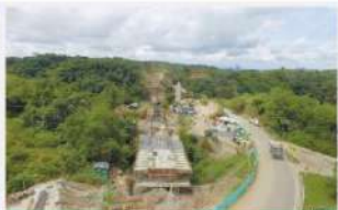
AUTOPISTAS DEL NORDESTE AVANZA A TODA MARCHA PAG 6