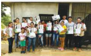
SEGUIMOS CAPACITANDO LAS COMUNIDADES PAG 2

BOLETÍN INFORMATIVO TRIMESTRAL | CONCESIÓN AUTOPISTAS DEL NORDESTE | EDICIÓN 10 - DICIEMBRE DE 2017