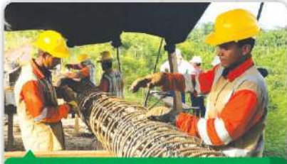
GENERACIÓN DE EMPLEOS PARA HOMBRES