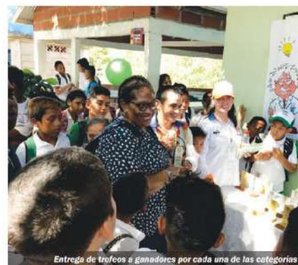
Entrega de trofeos a ganadores por cada una de las categorías

La Concesión Autopistas del Nordeste participó de la Sexta Feria de la Ciencia, organizada por la Institución Educativa Rural La Pajuela del municipio de Zaragoza. Esta actividad en la que se destacó la creatividad y el ingenio de sus estudiantes se llevó a cabo durante una jornada académica, en la que las mejores muestras expuestas por los niños y educadores fueron premiadas.