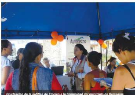
Divulgación de la política de Empleo a la comunidad del municipio de Remedios

Alrededor de 40 personas interesadas en una oportunidad laboral asistieron al evento, de los cuales 17 fueron vinculados al proyecto, generando de este modo estabilidad laboral para sus familias. Esta es una de las diversas actividades que se realizarán a lo largo del corredor vial, para garantizar la vinculación laboral de los habitantes de los municipios del área de influencia directa del proyecto Autopista Conexión Norte.