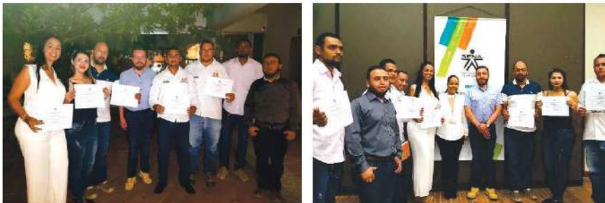
Entrega de certificaciones personal Autopistas del Nordeste

A través del convenio con el Servicio Nacional de Aprendizaje SENA, la Concesión Autopistas del Nordeste logró la certificación por competencias laborales en Atención al Cliente a 29 personas vinculadas al proyecto Autopista Conexión Norte, entre Auxiliares Administrativas, Conductores, Radio Operadores e Inspectores Viales, entre otros. Esta iniciativa busca cualificar la mano de obra del área de influencia del proyecto.