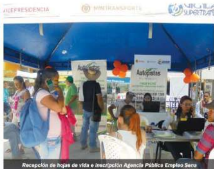
Recepción de hojas de vida e inscripción Agencia Pública Empleo Sena