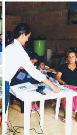
Entrega de certificaciones en barrio Buenos Aires 1- Cauca