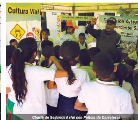
Charla de Seguridad vial con Policía de Carreteras

La Concesión participó con dos stands a través de los cuales brindó charla de seguridad vial, entregó piezas de divulgación, cartillas educativas, gorras alusivas a la Feria, además de la exposición de Epífita y piezas arqueológicas.