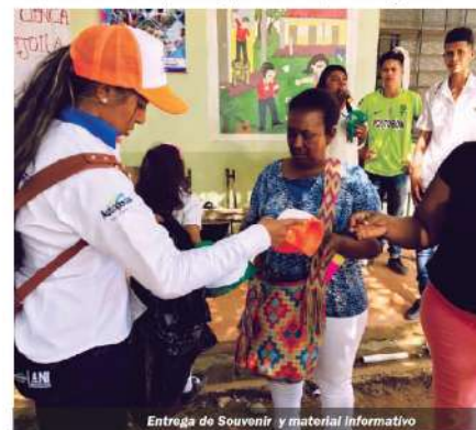
Entrega de Souvenir y material informativo

La Concesión participó con dos stands a través de los cuales brindó charla de seguridad vial, entregó piezas de divulgación, cartillas educativas, gorras alusivas a la Feria, además de la exposición de Epífita y piezas arqueológicas.