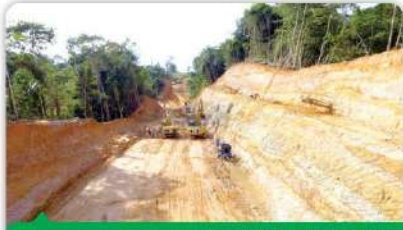
CONSTRUCCIÓN DE VÍA NUEVA ENTRE ZARAGOZA, SEGOVIA, REMEDIOS