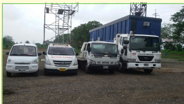
Variedad de servicios para atender todo tipo de accidentes y eventualidades que se puedan presentar en la vía.

El concesionario viene adelantando las labores de rocería, limpieza de cunetas y alcantarillas; Así mismo, se adelantó la inspección del estado de la carpeta asfáltica a fin de dar inicio a su mantenimiento; para ello, se contrataron 156 persona entre hombres y mujeres pertenecientes a los Municipios de Caucaasia y Zaragoza.