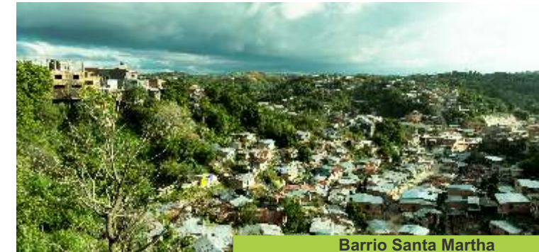
Barrio Santa Martha

de hogar, quienes a través del 'chatarreo' recolectan la esperanza para su familia. En los ocasin de los horizontes segovianos siempre se asoma la esperanza para los corazones que laten día a día por sus calles.