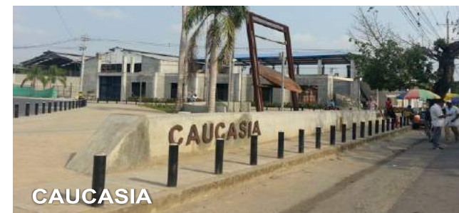
Caucasia en Línea

El proyecto "Autopista Conexión Norte", consiste en el diseño y la construcción de una vía en calzada sencilla entre los municipios de Remedios y Zaragoza, solucionando la movilización a los municipios del nordeste antioqueño. Como parte del mismo proyecto se realizará el mejoramiento de la calzada actual del tramo Zaragoza-Caucasia, así como la construcción de una variante en calzada sencilla en Cauca; las obras objeto de esta concesión tienen una longitud estimada de 145 kilómetros.