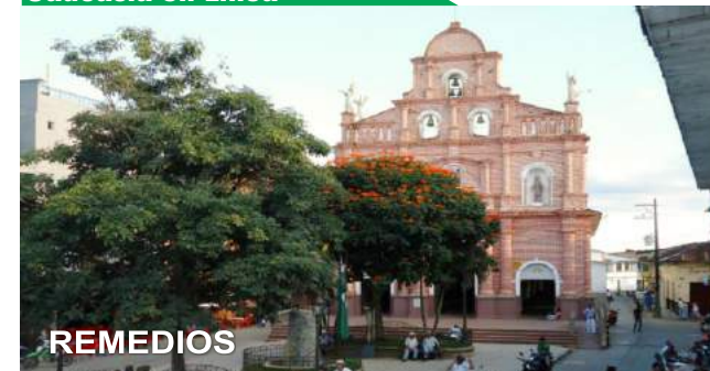
Remedios en Línea