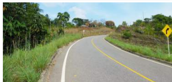
Proyecto: Autopista Conexión Norte

Trabajamos en Asociación Público Privada con la Agencia Nacional de Infraestructura (ANI), que tiene como propósito "Generar prosperidad democrática y competitividad a través de un sistema moderno de transporte, infraestructura y servicios que facilita la movilización nacional e internacional de pasajeros y carga, y la presencia efectiva del Estado en el territorio nacional".